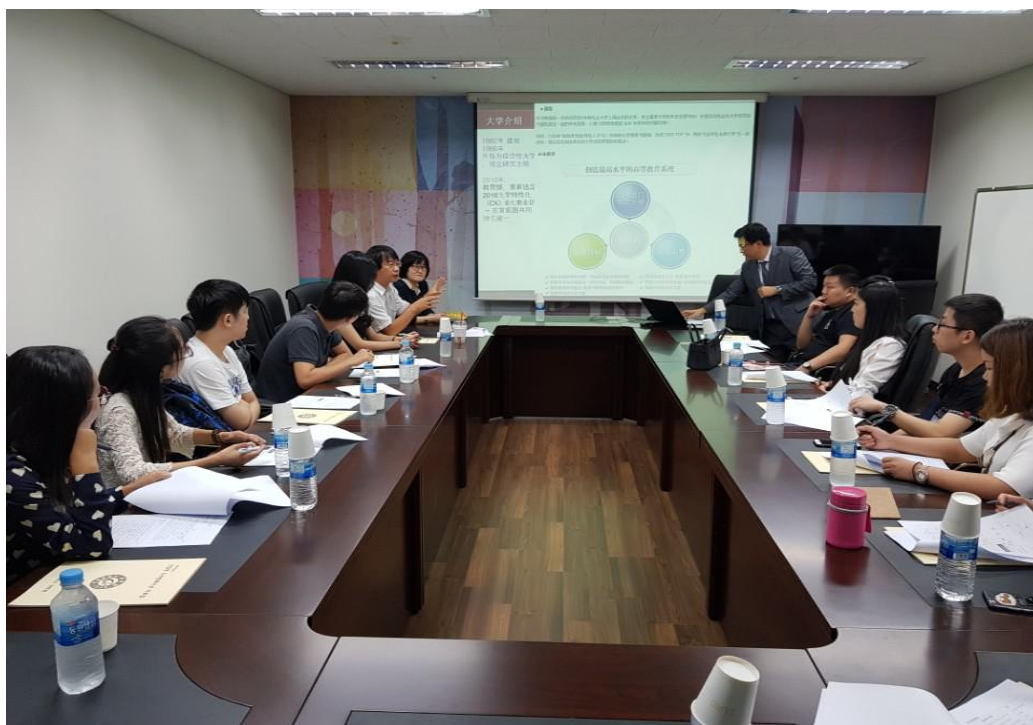
(摄于 2017 年 9 月课堂)